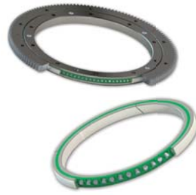
Cuscinetti con anelli trafilati e calandrati Bearings with drawn and calendered rings