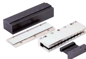
Motori lineari Linear motors