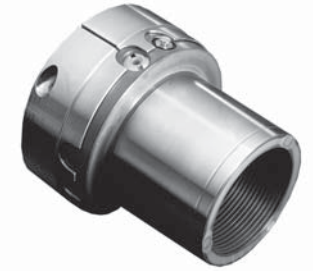
Giunti di sicurezza Safety couplings