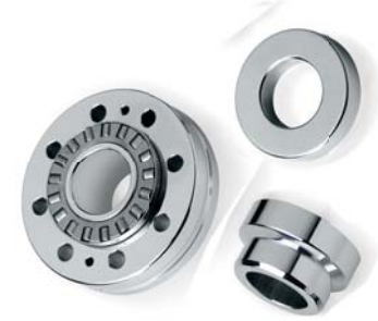
Cuscinetti supporto viti a ricircolo Bearing assemblies for ball screws support