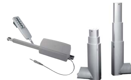
Attuatori lineari Linear actuators