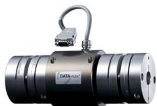
Torsiometri Torque measuring systems