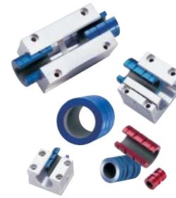
Manicotti a strisciamento Sliding bushings