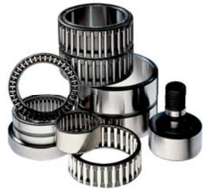
Cuscinetti a rulli e rullini Roller and needle roller bearings