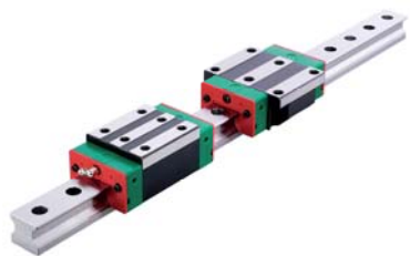
Guide a ricircolo di sfere e a rulli Ball and roller type guides