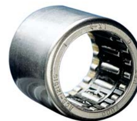
Ruote libere Overrunning clutches