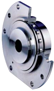
Giunti autoallineanti a rulli Roller self-aligning couplings