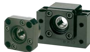
Supporti di precisione Precision ball screw support units