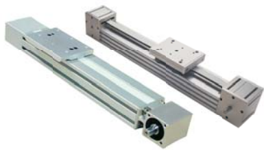
Modulo lineare PDU2/DLS Linear module PDU2/DLS