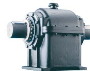
Giunti unidirezionali autosincronizzanti Self-synchronizing unidirectional automatic clutches