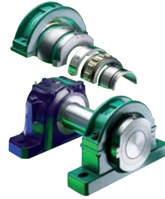
Cuscinetti in due metà con supporto Split roller bearings with support