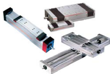
Tavole di posizionamento e moduli lineari Positioning units and linear modules