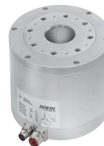
Tavole rotanti di posizionamento Positioning rotary tables