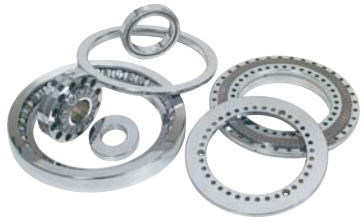
Cuscinetti speciali a rulli cilindrici Special cylindrical roller bearings