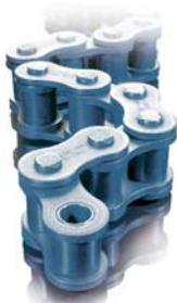
Catene a rulli Roller chains