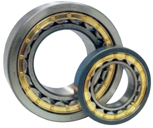
Cuscinetti a rulli per industria pesante Roller bearings for heavy industrial applications