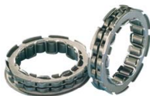
Ruote libere a corpi asimmetrici di contatto Borgwarner one-way clutches