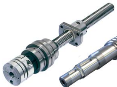
Viti a ricircolo di sfere rullate e rettificate Rolled and grounded ball screws