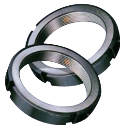
Ghiere di precisione Precision locknuts