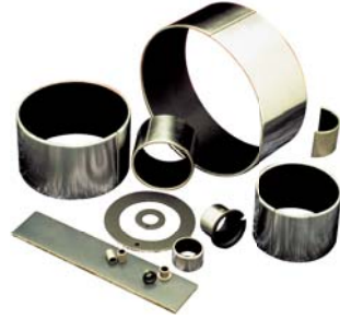
Cuscinetti a strisciamento Sliding bearings