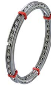
Cuscinetti a filo Wire ball bearings