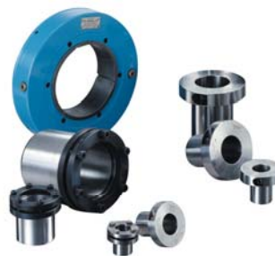
Unità di bloccaggio idrauliche Hydraulic Hub-Shaft connections