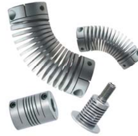
Giunti flessibili e molle di precisione Flexible couplings and machined springs