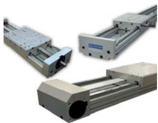
Modulo lineare MLM7 N Linear module MLM7 N