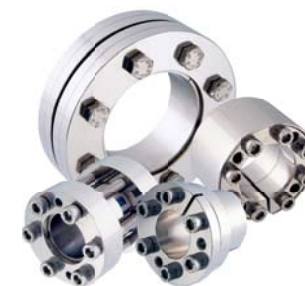
Calettatori per attrito Locking assemblies