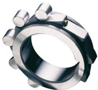
Ruote libere e antiritorno Overrunning clutches and Backstops