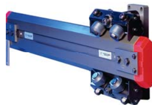
Sistemi di guida Linear systems