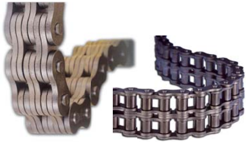
Catene a rulli e Fleyer Roller and Fleyer chains