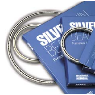
Cuscinetti di precisione a sezione sottile Precision thin section bearings