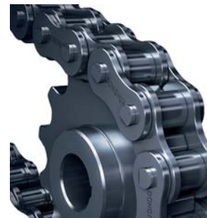
Catene standard e speciali Standard and customized chains