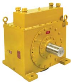
Giunti di arresto e dispositivi antiritorno Clutches and Backstops