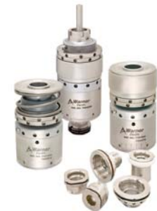
Teste avvitatrici magnetiche Magnetic capping headsets