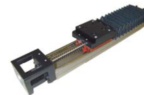
Moduli lineari KK KK linear modules