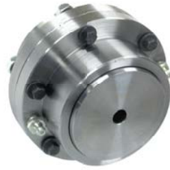
Giunti autoallineanti a denti Self-aligning tooth gear couplings