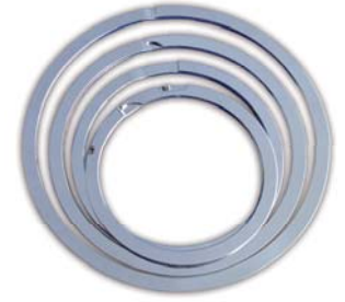
Segmenti lamellari di tenuta Sealing laminar rings