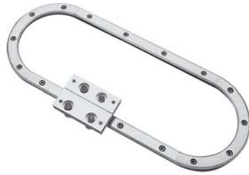
Sistemi di guida lineare e circolare Linear, Ring and Track Systems