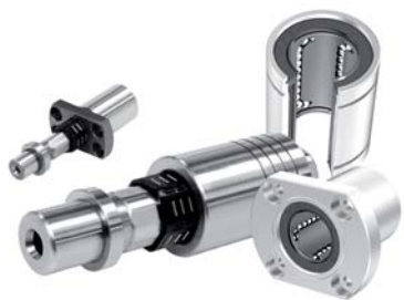
Bussole a ricircolo di sfere Ball bushing