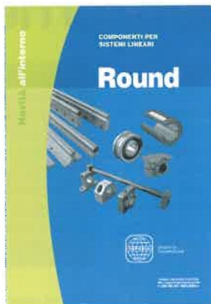
Il nuovo catalogo dedicato ai componenti per sistemi lineari Round di Mondial.

Chiude il nuovo catalogo Round di Mondial la selezione di alberi per movimenti lineari completa di supporti per le estremità e di supporti continui. ■■