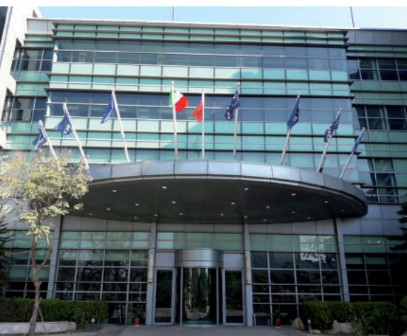
La sede di Apex Dynamics a Taichung City, Taiwan. L'azienda è nota in tutto il mondo nel settore della trasmissione di potenza.

Costruiti in lega d'acciaio ad alta resistenza, con cassa in corpo unico, i riduttori epicicloidali Apex Dynamics presentano: gioco ridotto e stabile nel tempo, bassa rumorosità, minimo errore di trasmissione, alta efficienza, riscaldamento contenuto, alta coppia di trasmissione, ampia disponibilità di taglie e rapporti di trasmissione, protezione IP65. Disponibili nel programma Apex Dynamics anche una gamma completa di cremagliere a denti dritti e inclinati, con relativi pignoni a denti dritti ed elicoidali, e un sistema rivoluzionario di fissaggio del pignone al riduttore, brevettato e denominato "Curvic Plate".